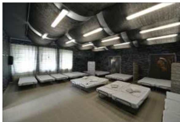
Kohauzing – společné ubytování