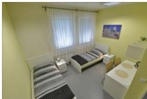
Pokoj B – žlutý