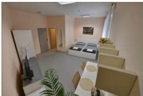
Pokoj A – oranžový

Moderně vybavené dvoulůžkové pokoje jsou vybaveny vlastním sociálním zařízením, televizí, lednicí a rychlovarnou konvicí. Do pokojů je možno umístit přistýlku – skládací postel. V oranžovém pokoji je umístěna manželská postel, ve žlutém pokoji dvě samostatná lůžka.